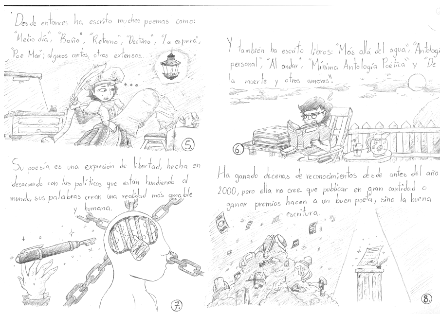
Figura 3. Tercera hoja del cómic