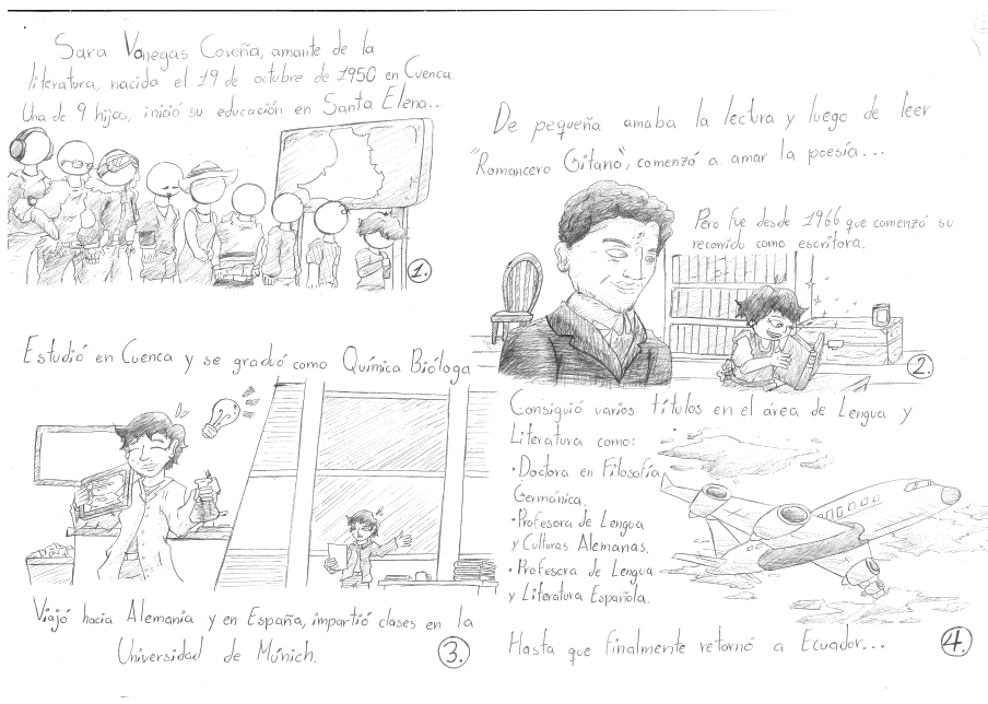
Figura 2. Segunda hoja del cómic