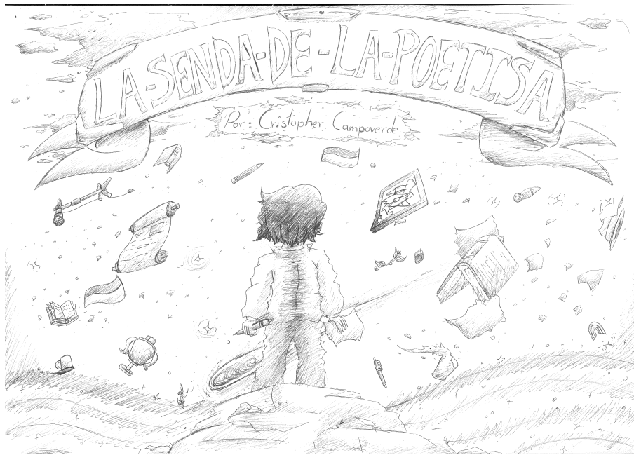
Figura 1. Primera hoja de mi cómic: La senda de la poetisa