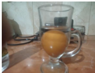
Figura 3. Huevo colocado en la copa de vidrio junto con el vinagre