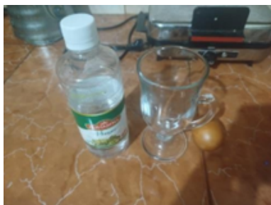
Figura 1. Materiales utilizados: vinagre, huevo y copa de vidrio

Para la realización del experimento se emplearon un vaso, vinagre y un huevo. El objetivo fue demostrar que, mediante la acción del vinagre, la cáscara del huevo se desintegra gradualmente, dejando una membrana flexible que confiere al huevo una consistencia suave y cierta capacidad de resistencia frente a impactos leves.