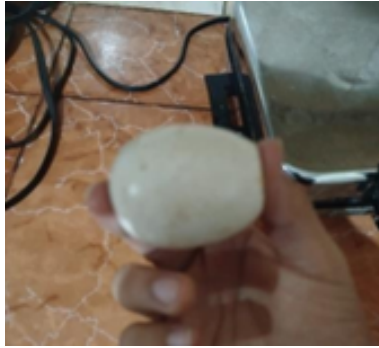
Figura 6. Huevo retirado de la copa de vidrio, sin cáscara

En este experimento sumergimos un huevo en vinagre durante 48 horas a los pocos minutos observamos como salían burbujas del huevo indicando una reacción química. Al pasar los días la cascara de fue desintegrando dejando una capa flexible, sin romperse.