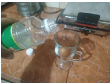
Figura 2. Huevo colocado en la copa de vidrio junto con el vinagre

El experimento se desarrolló de la siguiente manera: en primer lugar, se vertió una cantidad suficiente de vinagre en un vaso, de modo que cubriera completamente el huevo. Luego, se introdujo el huevo en el recipiente y se dejó reposar durante dos días para permitir que el vinagre actuara sobre la cáscara. Transcurrido ese tiempo, se extrajo el huevo y se dejó caer suavemente sobre una superficie firme con el fin de comprobar el resultado del experimento.