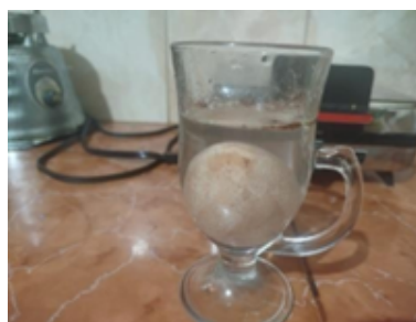
Figura 5. Formación de burbujas después de 24 horas

Se debe dejar reposar por 48 horas el huevo en el vinagre y observar los cambios pasadas las de 24 horas de iniciado el proceso.