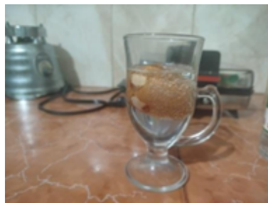
Figura 4. El vinagre vertido debe cubrir completamente el huevo