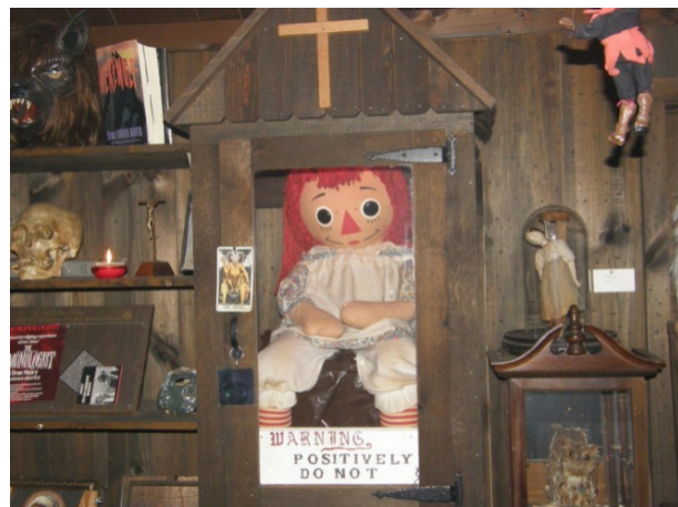
Figura 3. Muñeca Annabelle en el museo del ocultismo Fuente: [4]

Este caso fue considerado completamente real por quienes lo investigaron. Sin embargo, aunque las películas se presentan como basadas en hechos reales, en realidad se alejan bastante de la historia original. Por ejemplo, la película Annabelle: El origen no es más que una historia creada con fines comerciales. Además, la muñeca que aparece en las películas no es la verdadera, ya que su aspecto es diferente al de la muñeca original. La muñeca real se encuentra actualmente en el museo de los Warren, el cual está cerrado al público, dentro de una vitrina bajo llave que lleva un letrero con la advertencia “no abrir bajo ninguna circunstancia”.