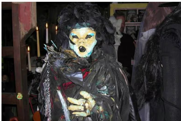
Figura 4. Muñeca Shadow en el museo de los Warren

Supuestamente, la muñeca fue creada con el propósito de enviar fotografías a personas que se tomaban el satanismo a broma. Quienes recibían estas imágenes, según el relato, caían bajo una maldición y comenzaban a tener pesadillas con la muñeca durante dos noches consecutivas; al tercer día, estas personas